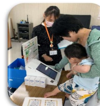
ドキドキの ベジチェック